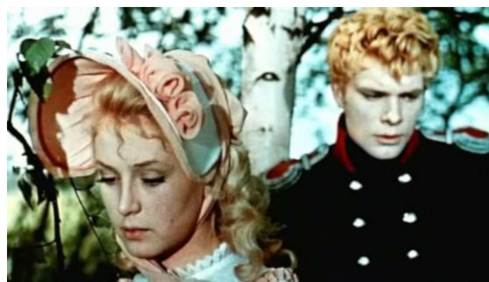
Кадры из к/ф «Метель»